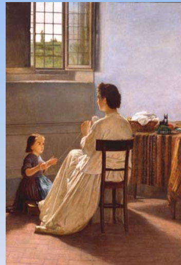
Silvestro Lega-Educazione al lavoro -1863 -olio su tela

Palermo 16 - 17 - 18 GENNAIO 2006 Palazzo Steri - Hotel President Palermo